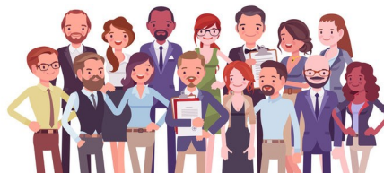
A4, B et C

5 % des effectifs se partagent 15% de l'enveloppe