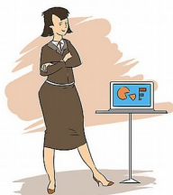
A1, A 2 et A 3

5 % des effectifs se partagent 15% de l'enveloppe